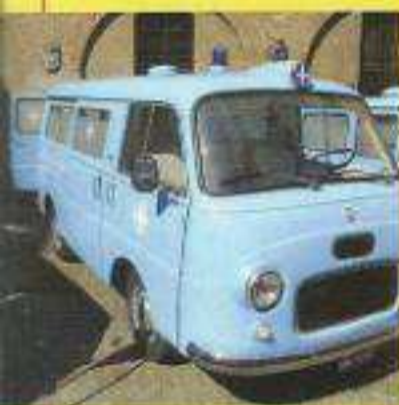
Foto: Dall'alto: S.p.A. - Spedimento in Abb. Postale D.L. 553/2003 (norme in L. 27/02/2004 n° 46) art. 3, comma 1, DCB Frato - Istituto Tecnico Scientifico, inserita al personale nei servizi di soccorso sanitario

• IL RISCHIO CLINICO NELLE PROCEDURE D'EMERGENZA DELLE C.O. 118 REGIONE PUGLIA